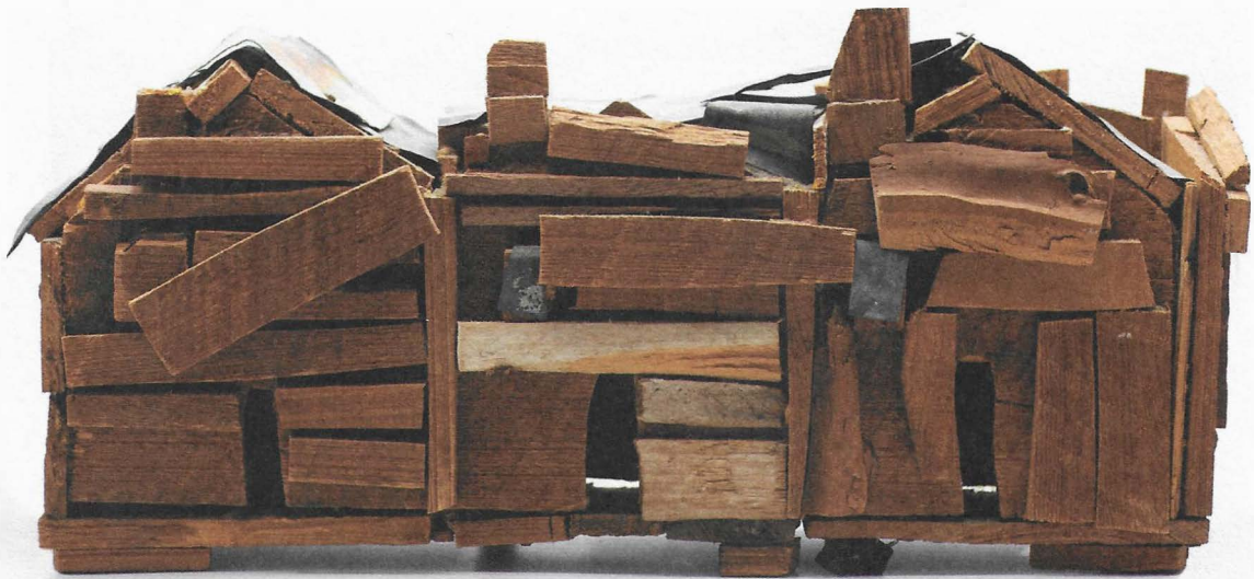
Beverly Buchanan, Shack Condominium , 1990, hout, spijkers, plaatmetaal en lijm, 14 x 41 x 21 cm, courtesy Beverly Buchanan Estate en Andrew Edlin Gallery, New York

In deze reeks gewijd aan kunstenaars die met hun werk de canon herzien, dit keer aandacht voor Beverly Buchanan. Met haar politiek geïnspireerde buitensculpturen verdiept ze - ook postuum - het perspectief op de verhalen achter het landschap.