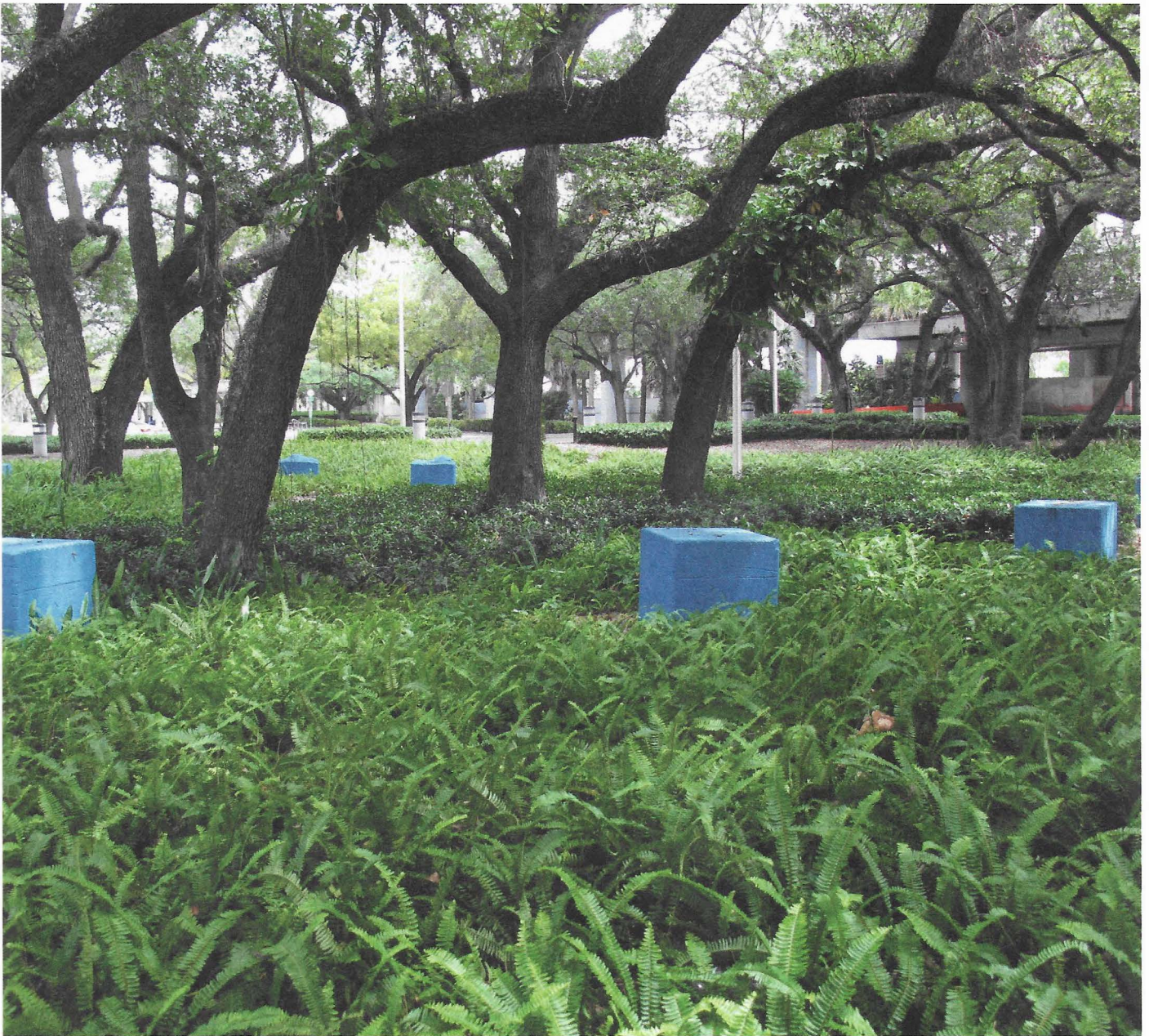
Beverly Buchanan, Blue Station Stones , 1986, Earlington Heights Metrorail Station, Miami, Florida, oorspronkelijk blauw geverfd, later opnieuw geverfd door de stad als een poging tot restauratie, foto Amelia Groom, 2019

tussen kunstwerk, de natuurlijke elementen en het landschap zijn echter fundamenteel in de betekenis van het werk.